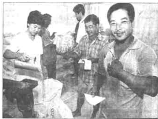
在全国率先推出“粮食银行”制度的广饶县，今年，农民交售公粮实行“一卡通”，既保证了公粮及时入库，又解决了农民储粮难的问题。