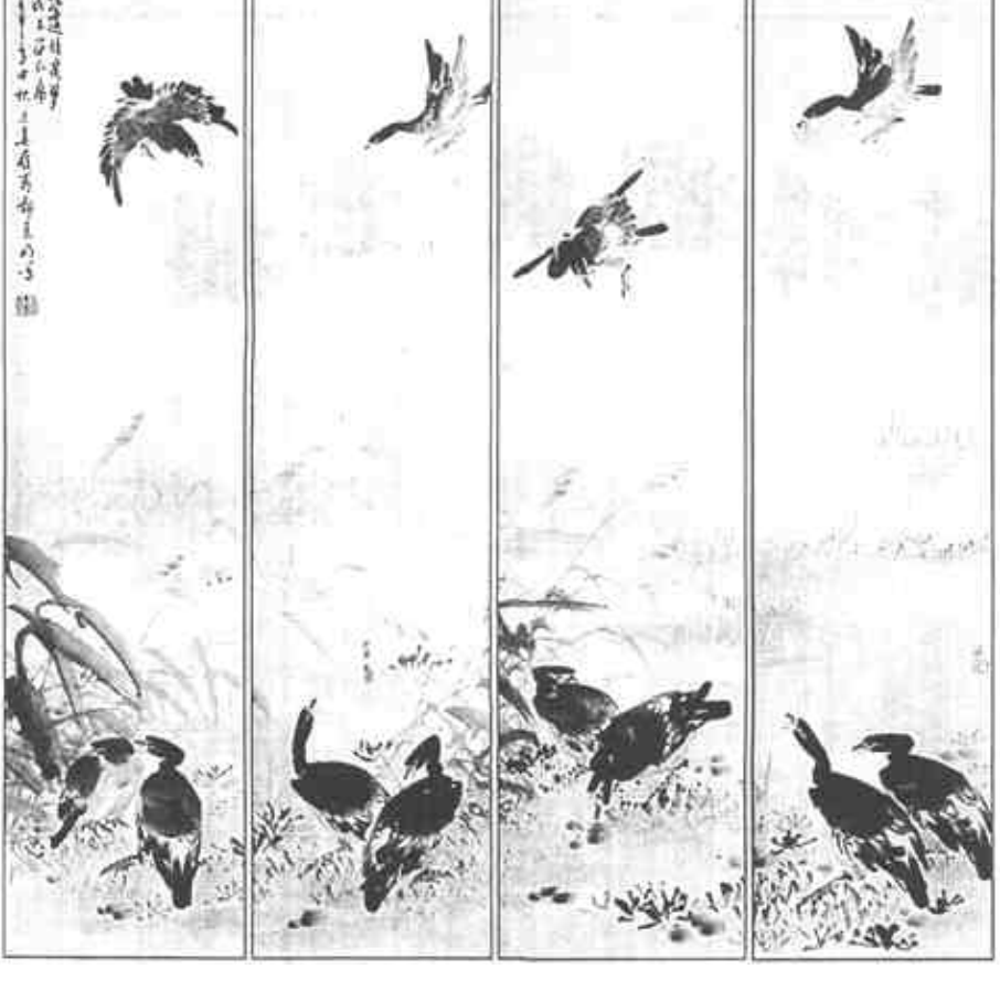
江边鹭客梦，泥上留爪痕 郑克明作