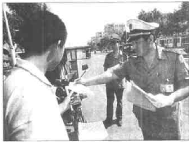
日前，市交警支队直属一大队在东城主要街道向行人、驾驶员发放宣传材料，为我市招商引资创造良好的环境进行道路畅通工程宣传。